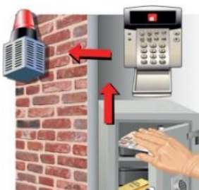
Anbindung an Einbruchmelde- anlage