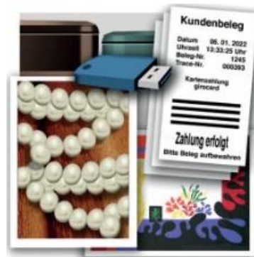
Wertsachen – Belege – digitale Aufbewahrung